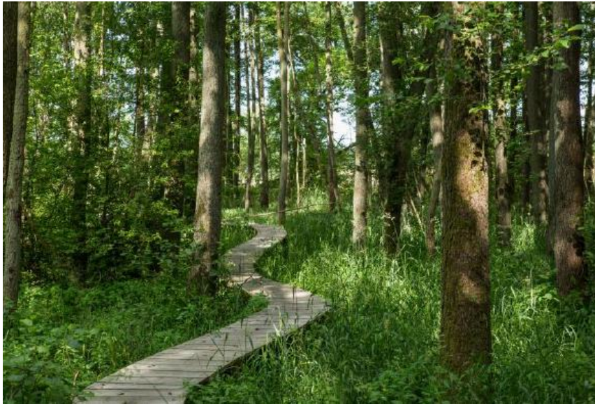
Billede af Elleskoven