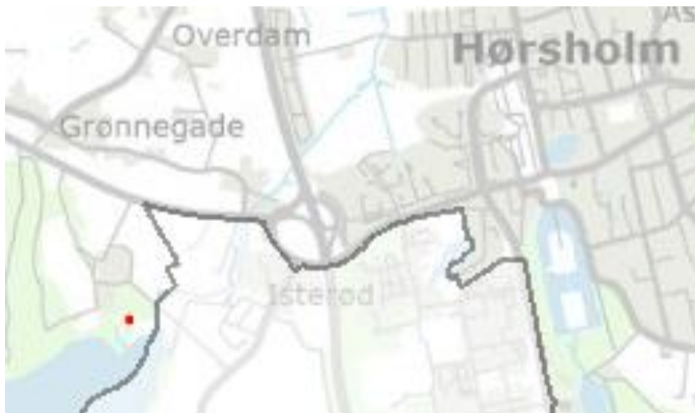
Formidlingsplatformens placering i Hørsholm kommune.