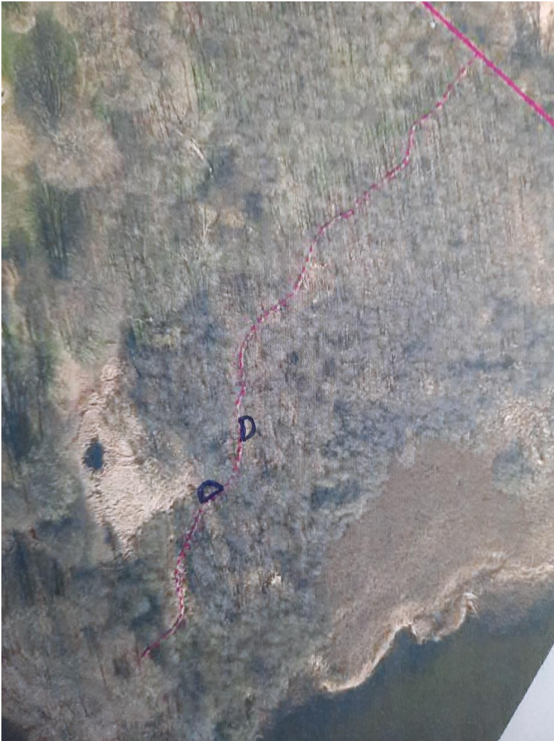
De D formede aftegninger viser de forventede placeringer af formidlingsplatformene i Elleskoven.