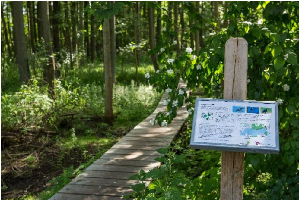
Træstien i elleskoven og eksisterende formidlingsplanche.